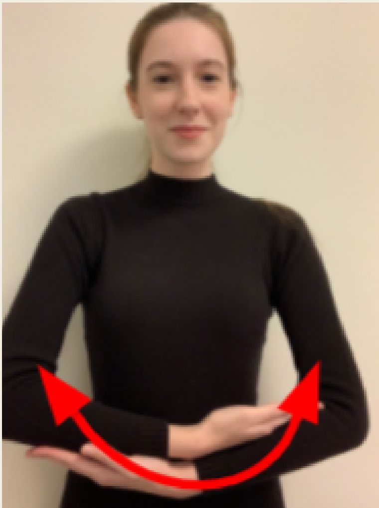
Bebê / Feto