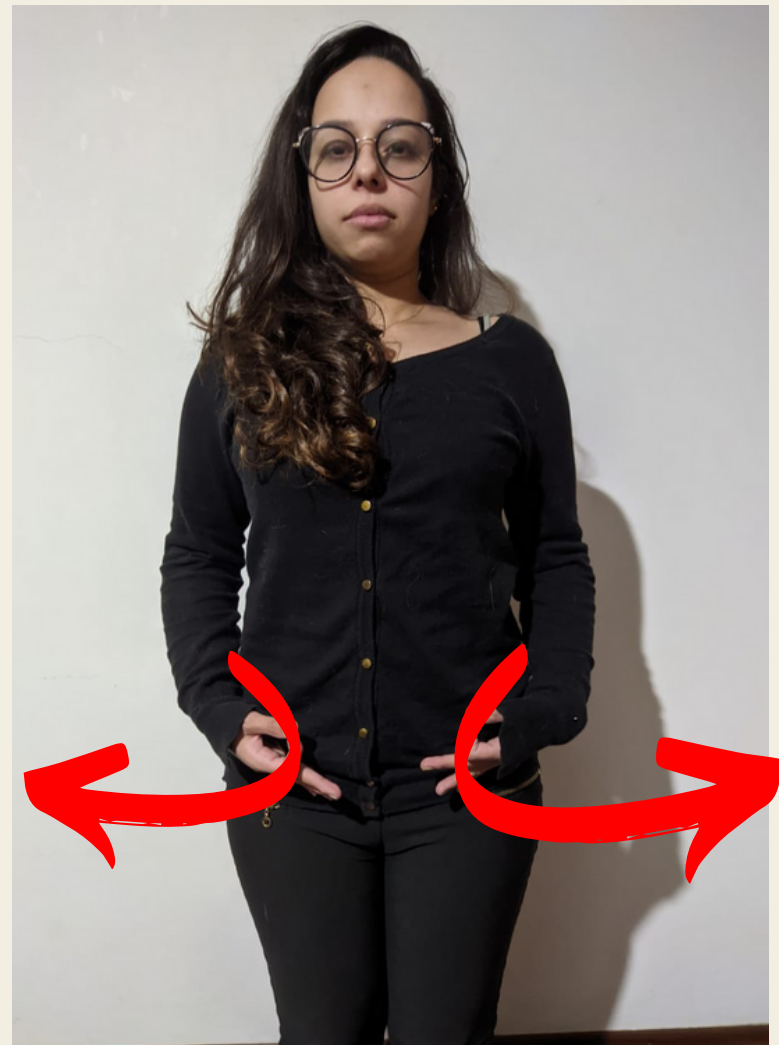
Parto / Nascimento