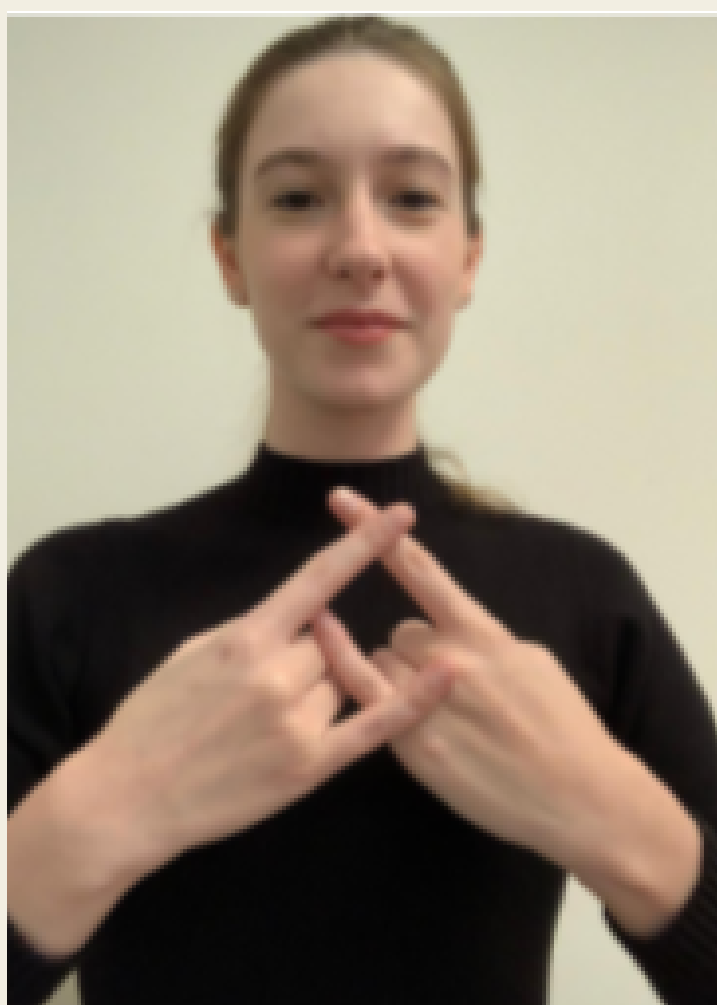
Camisinha / Preservativo