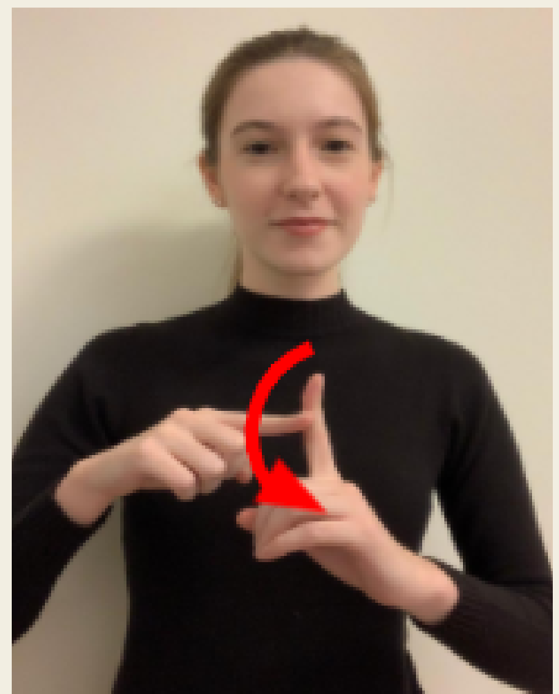
Gestante / Grávida